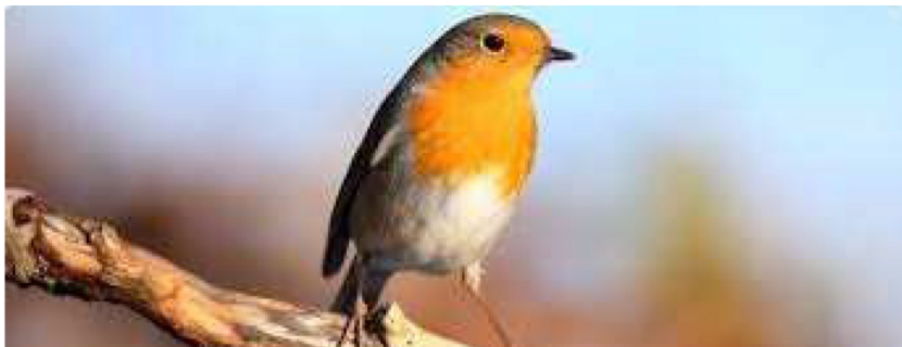
Association Maison de la Nature Jacques Bouillault-Simba Nature