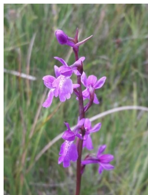
Anacamptis palustris , 2020, G. D'hier